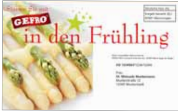
Selfmailer, Cover (195 x 122 mm)