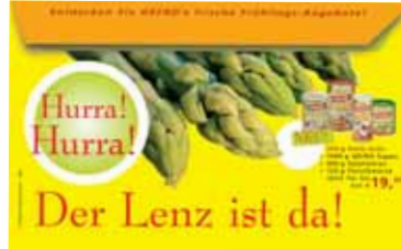
Rückseite (Verschluss-Klappe offen)