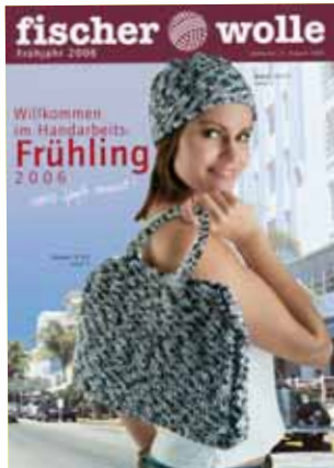
Titel (offen 204 x 290 mm)