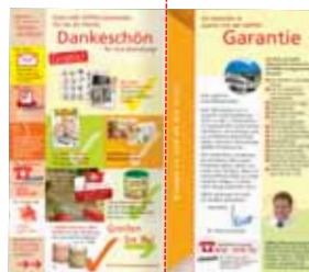
Seite 15, Umschlag →