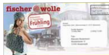
Selfmailer, Versand Cover (204 x 99 mm)

Fischer Wolle, Georg Fischer GmbH. Kreative Handarbeitsideen zum Stricken, Häkeln, Sticken, Knüpfen, Basteln und mehr. Über 4.500 Handarbeitsartikel. USP: Über 600 Original-Handarbeitsgarne (Fühlmuster) gratis für interessierte Kunden. Neukunden-Aquisition: Anzeigen, Paketbeilagen, Freundschaftswerbung. Basis-Werbemittel: Jahres-Hauptkatalog, Herbst-Winter-Katalog. Aktivierung Stammkunden: Frühjahrs mailing, Sommer-, Schnäppchen-, Kataloganforderungs-, Herbst- und TOP 1000 Mailing. Prämiensysteme: Sachprämien und Rabatte gestaffelt nach Bestellwert. Werbeagentur (seit 2002): Krempel & Putz